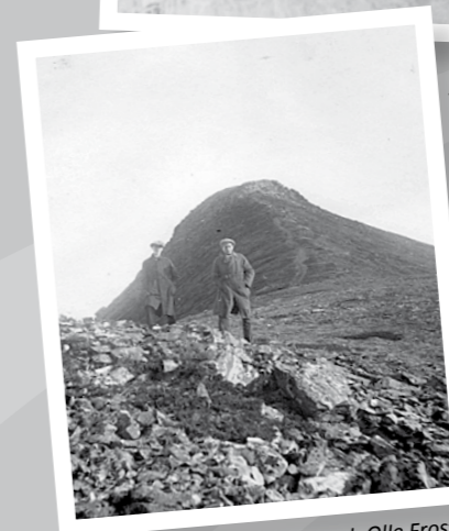
Från vänster Gustav Stein och Olle Frost med Städjan i bakgrunden.