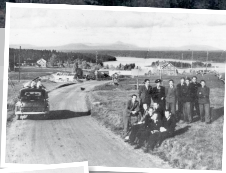
1940-talet. Evertsbergs fotbollslag på väg till Idre, Städjan i bakgrunden.