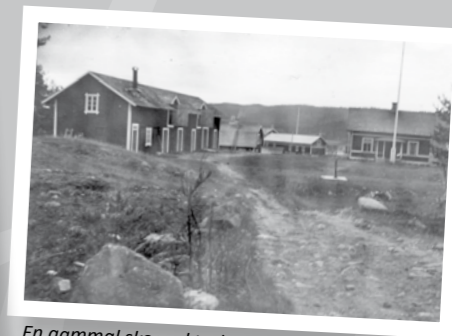
En gammal skogsvaktarbostad åt Korsnäs Idre.