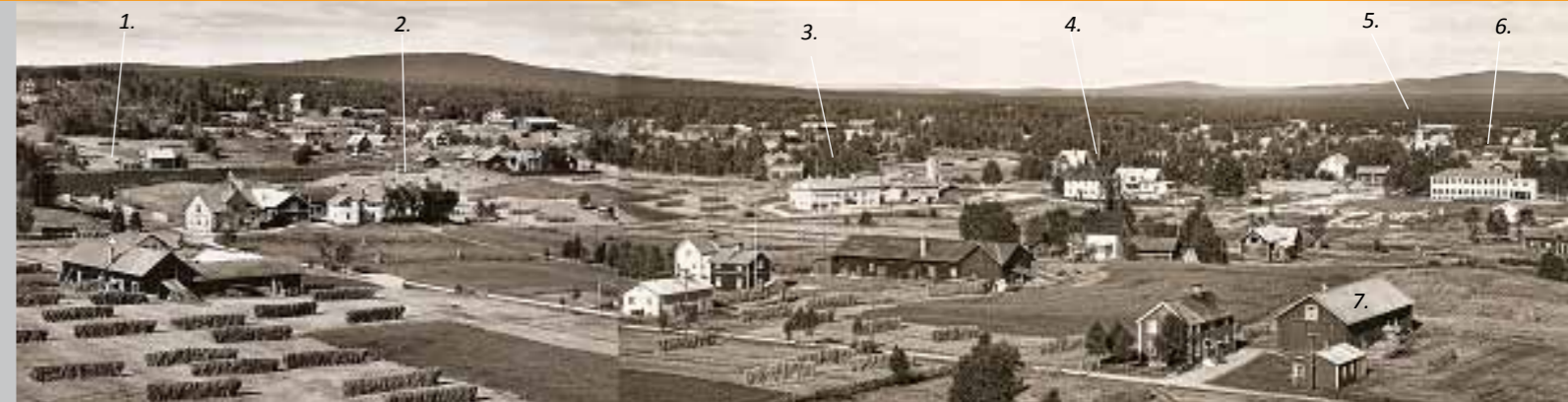
Så här såg Särna by ut vid senare delen av 1940-talet. Bilden är tagen från gamla hoppbacken. Vet du vad som är vad? Svaret hittar du lägst ned på sidan.

nar är daterade varvid den äldsta är från 1200-talet. Sveriges sista ”blåsning” av myrjärn i blåsterugn genomfördes i Särna på 1870-talet vid den sk Skrullblästan.