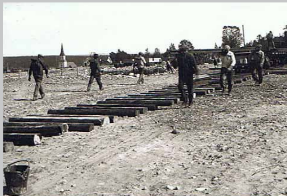
Järnvägen: Bilden är från 1927 när den sista delen av rälsen läggs ut vid Särna Järnvägsstation. Invigning i augusti 1928.

I Särna socken finns idag ett 60-tal kända järnframställningsplatser. Åtta ug-