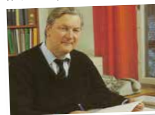
Bilder från boken "Skogen, älven och bygden" som gavs ut i samband med ÅB:s 100-års jubileum 1988.

Personalfester för anställda och styrelser turades man om att ha i Älvdalen respektive Särna. Festerna övergick så småningom till personalresor med skogliga teman. Trevliga arrangemang och nyttigt för personal och styrelser att träffas. För mig som gjorde lönerna så fick namnen på lönelistorna också ett ansikte - det var förhoppningsvis ömsesidigt. De som arbetade i Särna träffade man oftast bara då.